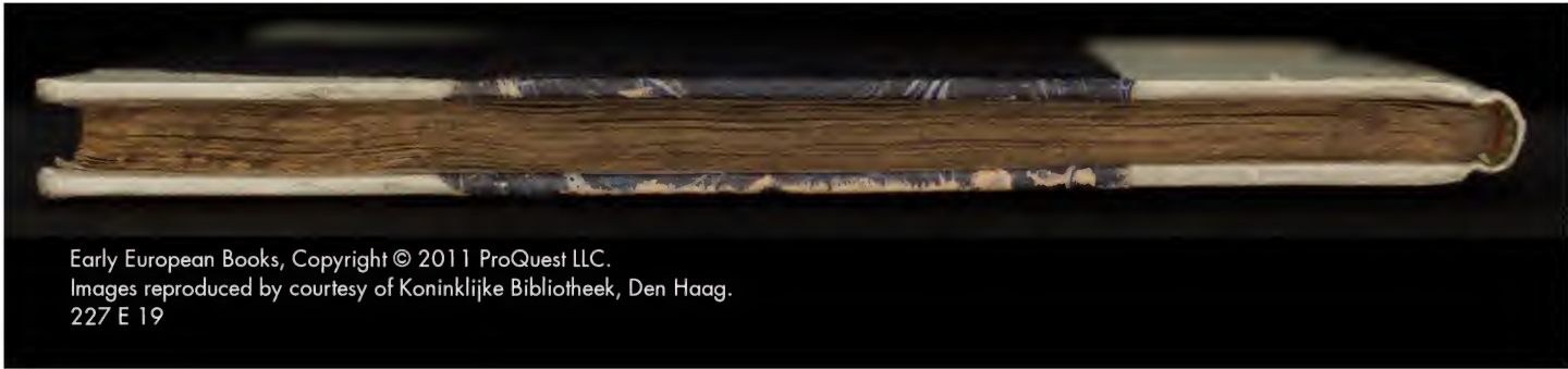
Early European Books, Copyright © 2011 ProQuest LLC. Images reproduced by courtesy of Koninklijke Bibliotheek, Den Haag. 227 E 19